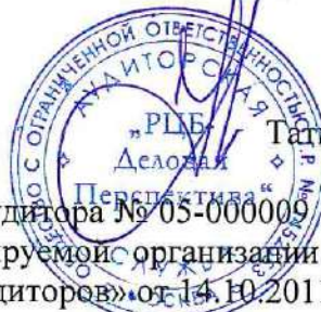
Татьяна Григорьевна Гринько

Квалификационный аттестат аудитора № 05-000009 (нового образца), выдан на основании Решения № 21 саморегулируемой организации аудиторов Некоммерческого партнерства «Российская Коллегия аудиторов» от 14.10.2011 г., на неограниченный срок).